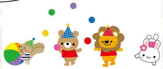
かくれんぼ中 せんせい、邪魔しないでね