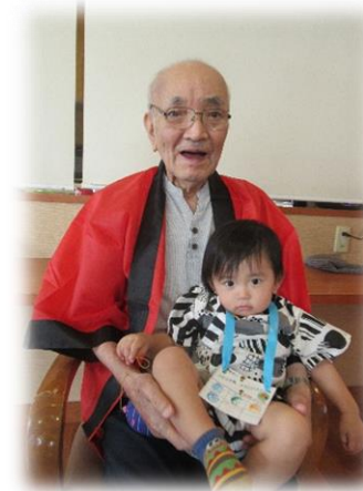
おじいちゃん、はいポーズ！