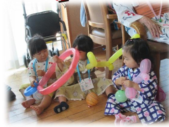
風船をもらって大喜び♪