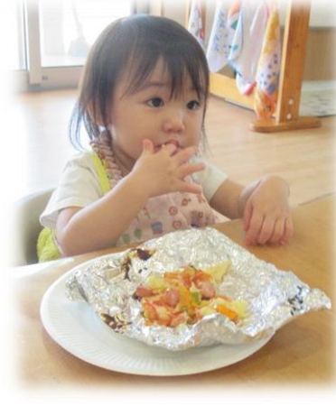
嫌いな野菜も食べられるよ！