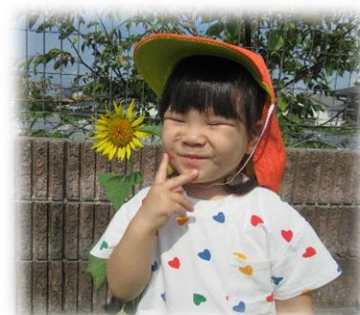
ひまわりと一緒にはいポーズ♪