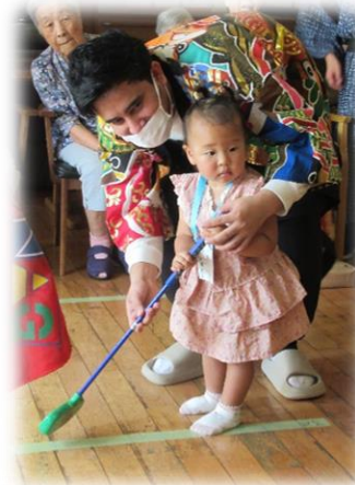
泣かずにできたよ！