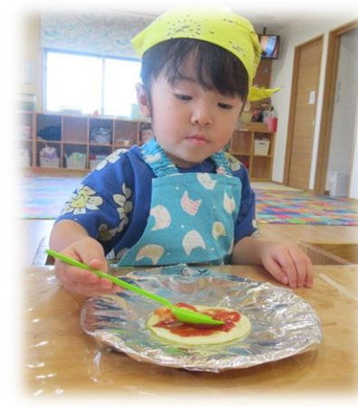
ピザソースをぬりぬり・・・なかなか様になっています(^_^)