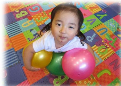
欲張りなんてしてないよ？！