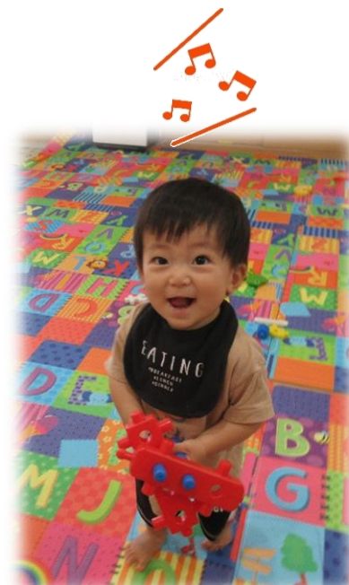
ほく、歩けるようになったんだ～