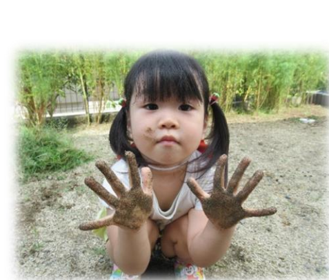
久しぶりの泥んこ遊びは楽しすぎたね！