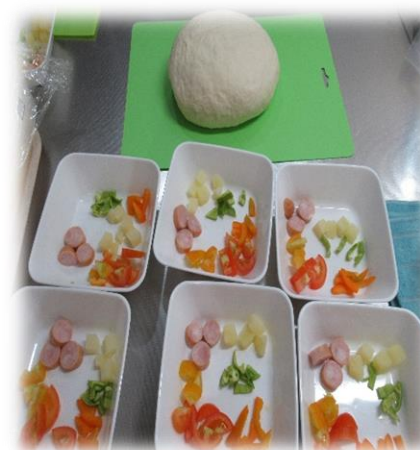
生地の発酵もトッピング材料も準備万端です