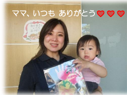
ママ、いつも ありがとう♥️♥️♥️