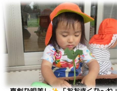
真剣な眼差し🌟「おおきくな〜れ」