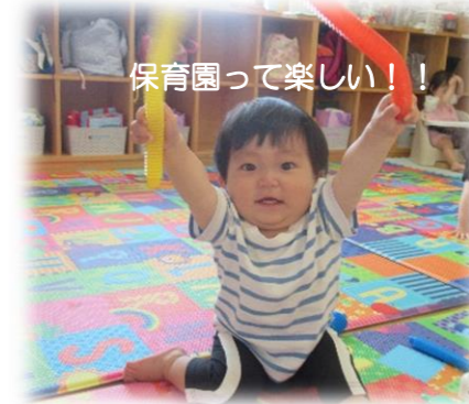
保育園って楽しい！！