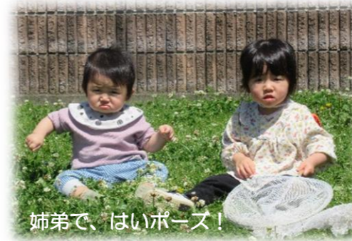
姉弟で、はいポーズ！