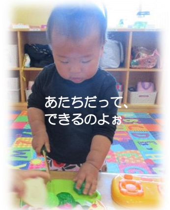
あたちだって、できるよお