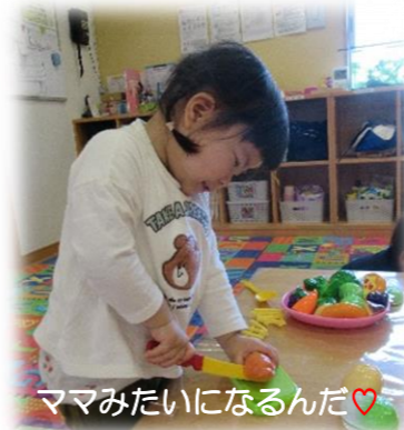
ママみたいになるんだ♥️