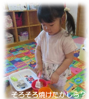
そろそろ焼けたかしら？