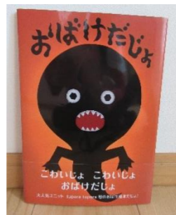
おばけだじょ 作:tupera tupera

ハラハラ、ドキドキのおばけの絵本！ ちょっとこわいお化けの正体はまさかの！！予想外の展開にびっくり、どっきり間違いなし。 子どもたちも大好きな絵本です♪