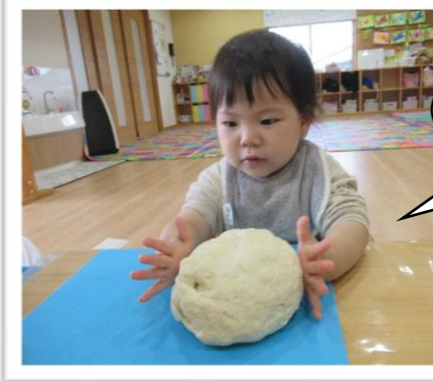
初めての小麦粉粘土！ 触っていいのかなあ～？