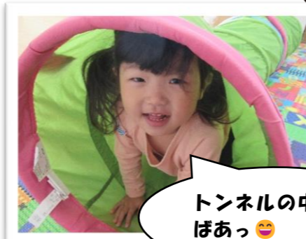
トンネルの中から ぼあっ 😊