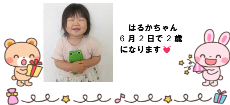
はるかちゃん 6月2日で2歳 になります♡