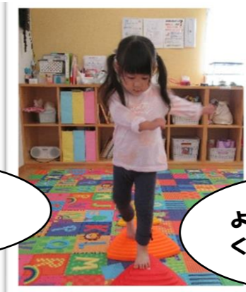
おいしょ！ボール くっつけてるよ 😊