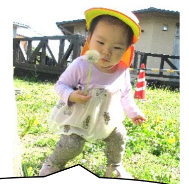
タンポポの綿毛見つけた!

新年度がスタートして一か月。保育所のリズムにも随分慣れた様子で、少しずつ楽しいことを見つけて、笑顔が多く見られるようになりました。 4月当初は泣いていたお友だちも時間が経つにつれ、玩具に興味を示したり保育士とのやり取りを楽しんだり、戸外で体を動かす事を喜んだり…それぞれ泣くこと以外の時間を過ごす様になって来ました。 ゴールデンウィークなどのお休みで、疲れが出てくる頃かもしれません。健康管理に注意しながら今月も元気に過ごしていきたいと思います。