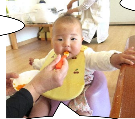
給食も美味しいよ