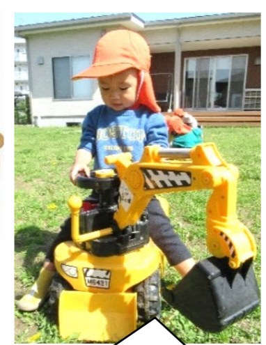
ショベルカーでお出掛け